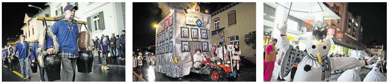
Vielfältiger Umzug: Die Bergtrychler, die Bergföhn-Clique mit «Wir vom Berg bauen ...» und die Turnerinnenriege Schönenberg, als Schneesturm verkleidet.