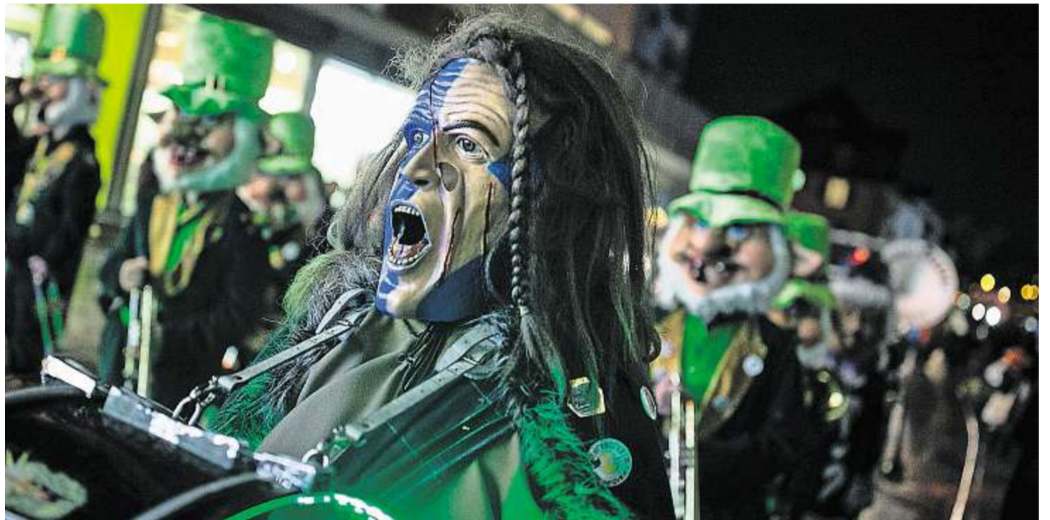
Die Wadin-Schränzer Wädischwyl sahen als Schotten mit blauer Kriegsbemalung besonders gfürchig aus.